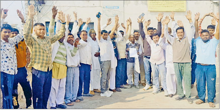
बवानीखेड़ा। मांगों को लेकर नारेबाजी करते हुए।

लोगों ने कहा- न्यायालय के आदेश न आने पर उनकी पीआईडी की आपत्ति पर लगाई जाए रोक