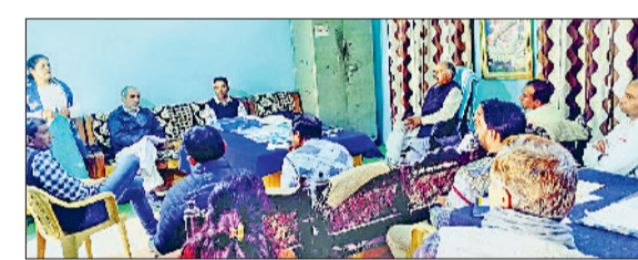
भिवानी। मीटिंग को संबोधित करते वक्ता।