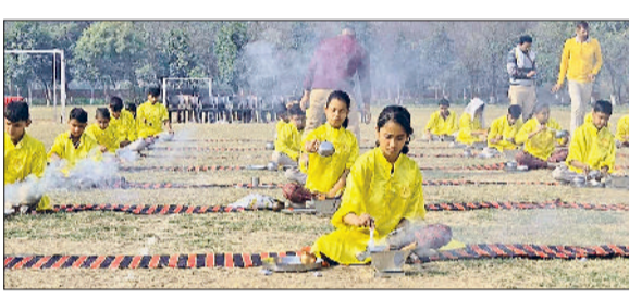
भिवानी। 51 कुंडीय यज्ञ करते बच्चे और अन्य।