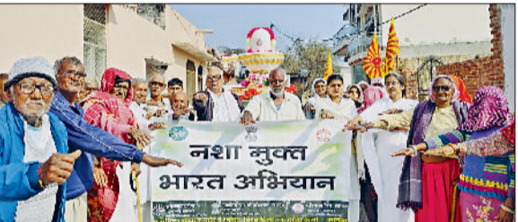
भिवानी। नशे के खिलाफ संकल्प लेते वीके भाई बहन व ग्रामीण।

नशा व्यक्तित्व निर्माण में बाधक, आर्थिक, शारीरिक व मानसिक रूप से बनाता कमजोर : वीके ज्योति