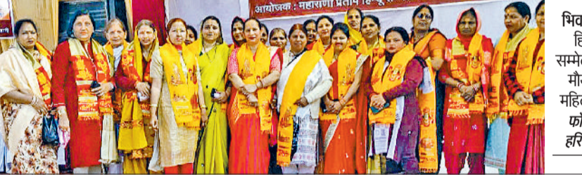
भिवानी। हिंदू सम्मेलन में मौजूद महिलाएं।