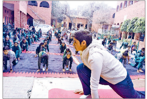
भिवानी। स्कूल में आयोजित कार्यक्रम में योग करते बच्चे।