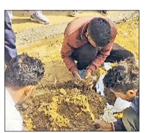
चरखी दादरी। सड़क निर्माण में लगी सामग्री का सैंपल लेते अधिकारी।