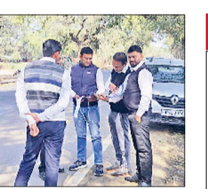
चरखी दादरी। सड़क निर्माण में लगी सामग्री का सैंपल लेते अधिकारी।