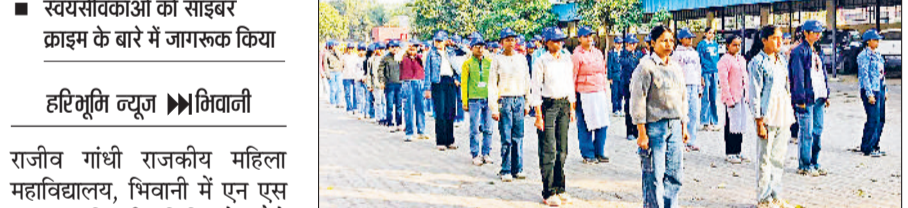
भिवानी। शिविर में कैडेट्स को जानकारी देते हुए।