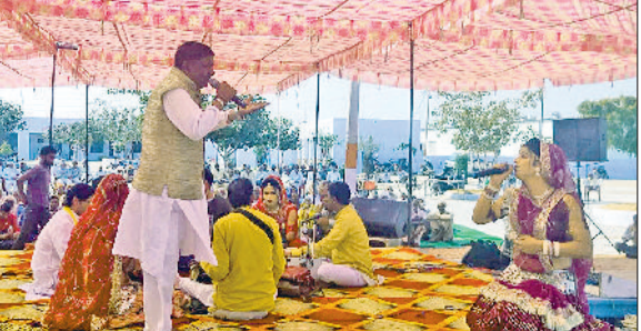
भिवानी। पिंगला भरतरी सांग का मंचन करते कलाकार।

गांव बापोड़ा स्थित बाबा पंचवीर गौशाला में मंगलवार से सात दिवसीय हरियाणवी सांग महोत्सव का हर्षोल्लास के साथ आगाज हुआ। हरियाणा कला परिषद रोहताक मंडल के सौजन्य से आयोजित महोत्सव का मुख्य उद्देश्य मनोरंजन एवं गो-माता की सेवा के लिए कोष एकत्रित करना है। 16 फरवरी सात दिनों तक हरियाणा के प्रसिद्ध कलाकार अपनी कला के माध्यम से दर्शकों को निहाल करेंगे। महोत्सव