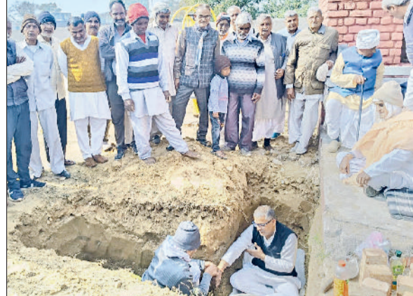
बाढ़ड़ा। कम्प्यूनिटी सेंटर के भवन की नींव रखते हुए।